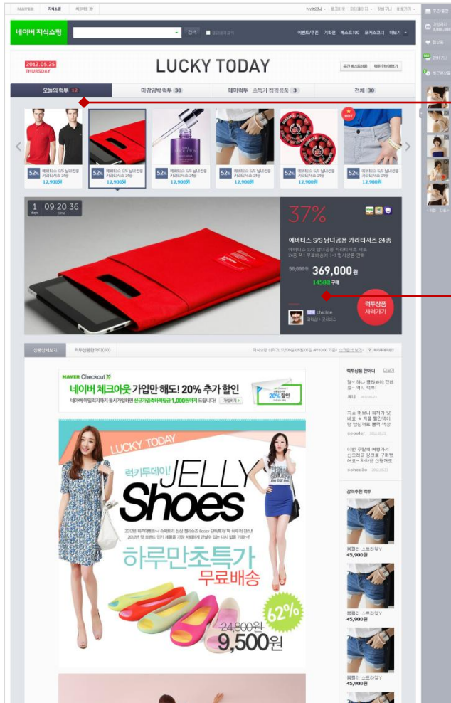
[그림1. 럭키투데이 메인 페이지 Home]